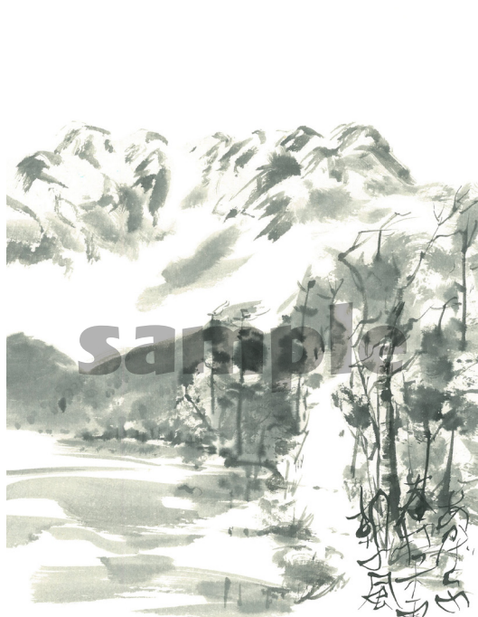
はるう こだまあき かぜ あかげらの春打つ木霊朝の風